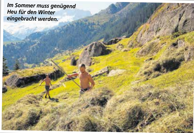
Im Sommer muss genügend Heu für den Winter eingebracht werden.

Bestellung: www.gislodruck.ch/buecher , in Buchhandlungen oder direkt beim Autor: www.bachofner.ch , Telefon 052 624 58 48.